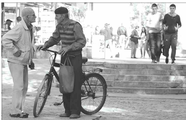
МАНИПУЛАЦИЈЕ Број "фиктивних Албанаца" у Бујановцу расте

- У Бујановцу сигурно не живи 23.631 Албанац, коли-