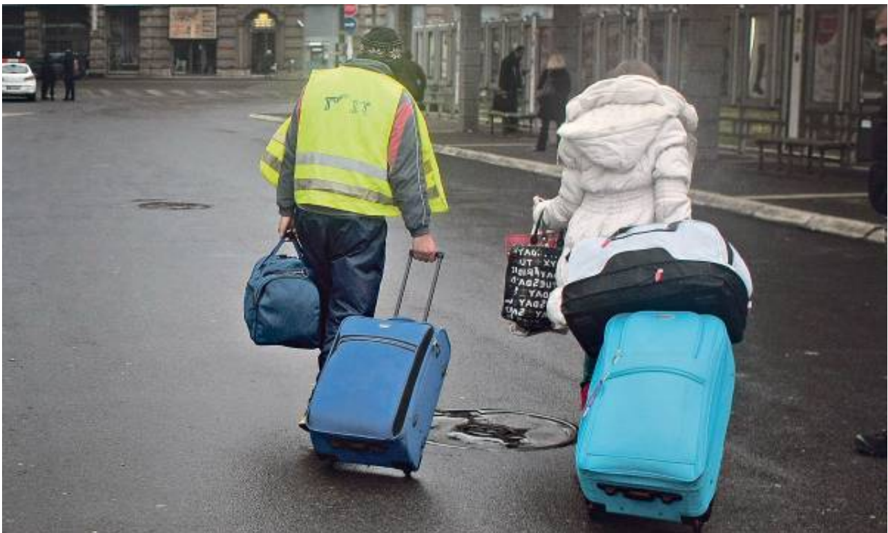
Najveći broj ljudi stigao iz drugih gradova naše zemlje

Od 2006. do 2011. godine u Beograd se doselilo tačno 84.839 ljudi, pokazuju podaci Republičkog zavoda za statistiku . Od tog broja, 68.341 osoba živela je u nekom drugom gradu u Srbiji, a novu adresu u srpskoj prestonici potražilo je i 16.445 stranaca. Procena je da se u glavni grad od 2011. doselilo još najmanje 25.000 ljudi.