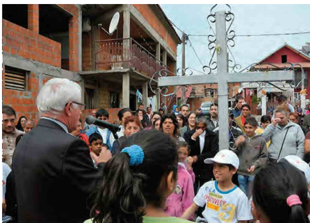
МЕЂУ НАЦИОНАЛНИМ МАЂИНАМА У КРАГУЈЕВЦУ ГОТОВО ПОЛОВИНУ ЧИНЕ РОМИ