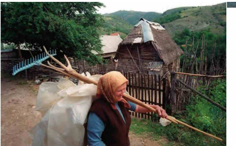
У СЕЛИМА КРАГУЈЕВАЧКЕ ОПШТИНЕ БРОЈ ЖИТЕЉА ПАО ЗА ТРИ ХИЉАДЕ