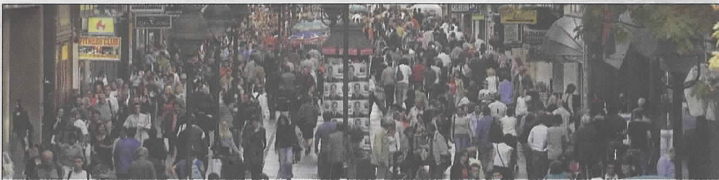
ПРЕТРПАНО Највећа гужва у Београду