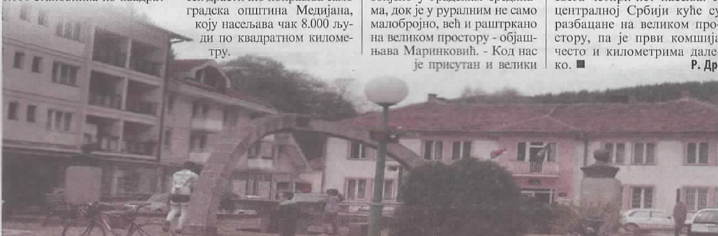
ПУСТИЊА У Црној Трави тешко је некога срести