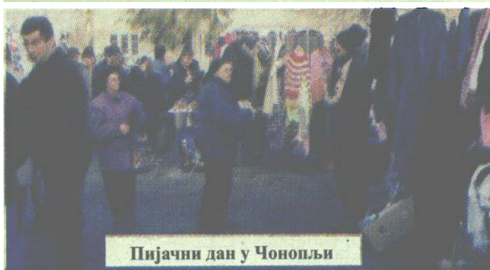
Пијачни дан у Чонопљи