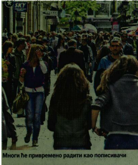
Многи ће привремено радити као пописивачи