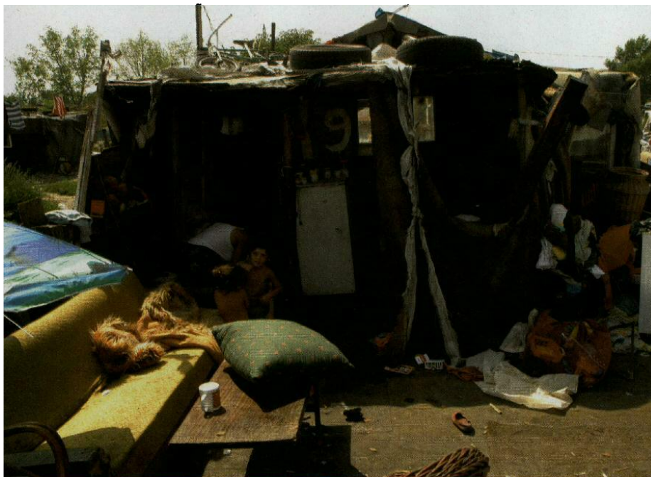
Роме ће пописивати њихови представници

пис раде на традиционалан начин, на терену у живом контакту путем интервјуа. У Хрватској, Македонији и Црној Гори попис је коштао више од 500 динара по становнику. Друго, требало је за овај посао припремити и ромску популацију.