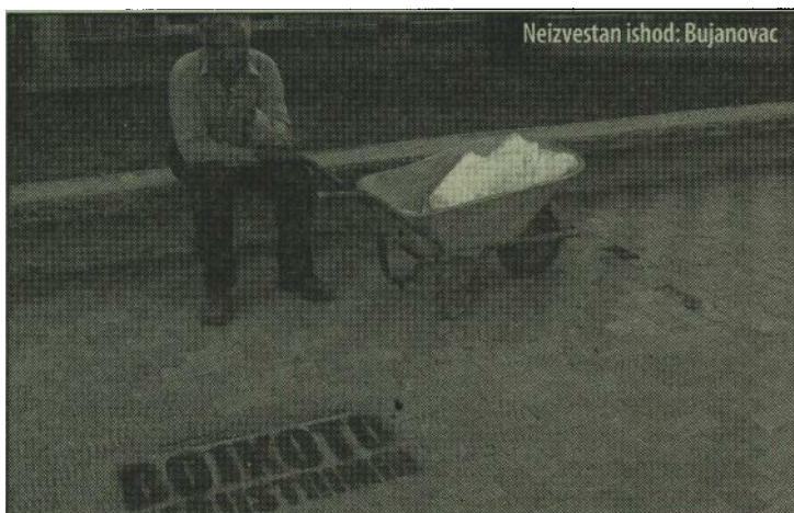
Neizvestan ishod: Bujanovac

U Republičkom zavodu za statistiku zadovoljni odzivom građana, na jugu Srbije i u Sandžaku tvrde da je izlaznost zanemarljiva