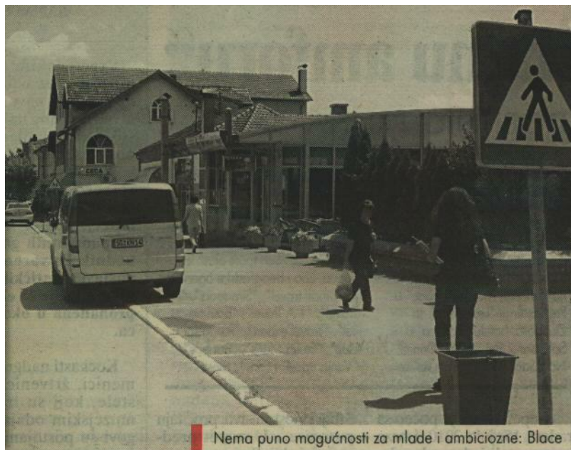
Nema puno mogućnosti za mlade i ambiciozne: Blace

Nije baš sve tako crno kao što izgleda. Ja sa svojom porodicom živim od poljoprivrede. Istina, nema tu neke velike zarade, ali se bar preživljava u ova teška vremena. Ne planiram da napustim moj grad i mesto gde sam rođen, bar ne za sada.